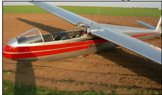
14. Mai PKW Bergung